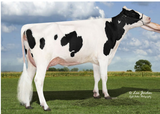
SCENERY-VIEW CRYSTAL THIRD DAM