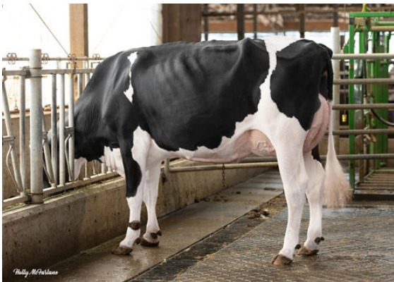
PROGENESIS EINSTEIN EVEN P DAM